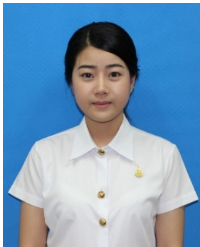
นักศึกษาหญิง