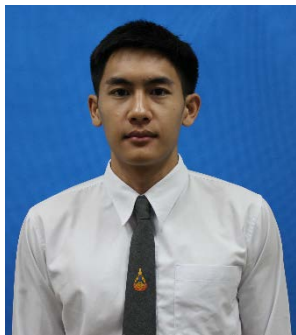
นักศึกษาชาย