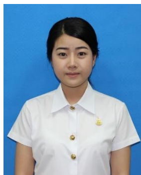
นักศึกษาหญิง