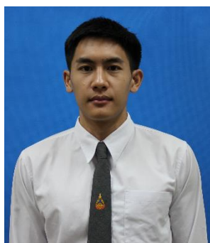
นักศึกษาชาย