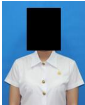
นักศึกษาหญิง