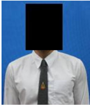
นักศึกษาชาย