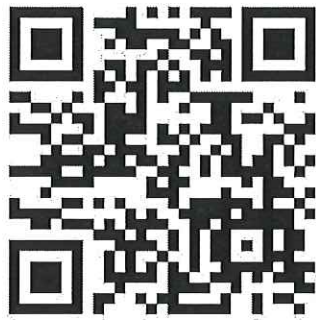
แผนที่การเดินทง อาคารศูนย์ความเป็นเลิศทางการแพทย โรงพยาบาลมหาวิทยาลัยเทคโนโลยีสุรนารี