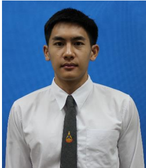
นักศึกษาชาย