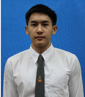
นักศึกษาชาย