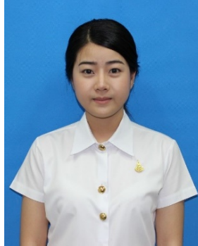
นักศึกษาหญิง