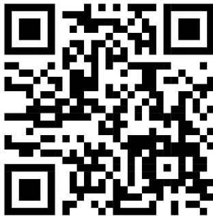
แผนที่การเดินทาง อาคารศูนย์ความเป็นเลิศทางการแพทย์ โรงพยาบาลมหาวิทยาลัยเทคโนโลยีสุรนารี